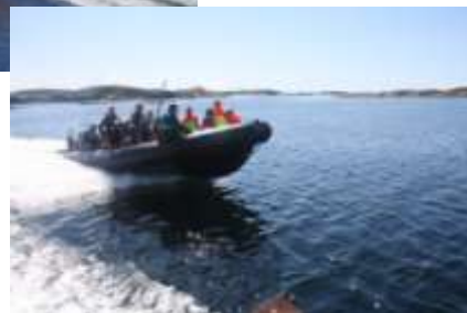
Einar i brygga Kåres transport Egils transport